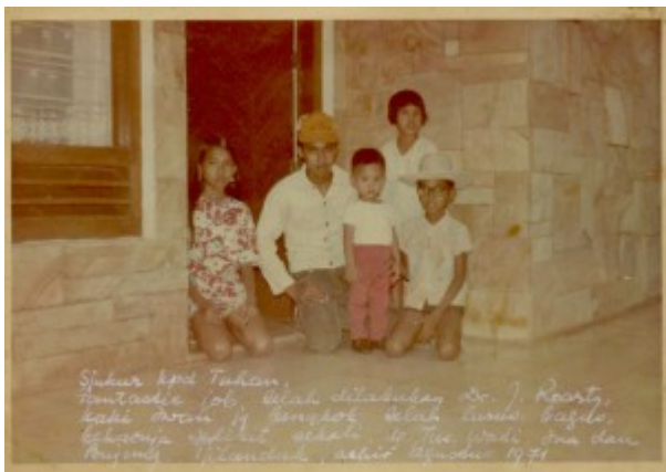
Ditemani dengan da'yus da'yung ni'wati dan ni'ina