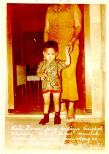
Kembali Belajar Melangkah