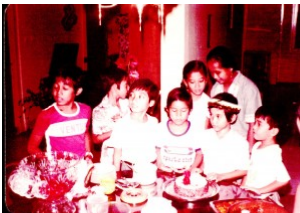
Ulang tahun yang ke-8