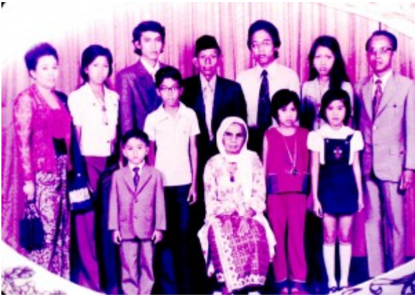
Foto bersama nenek